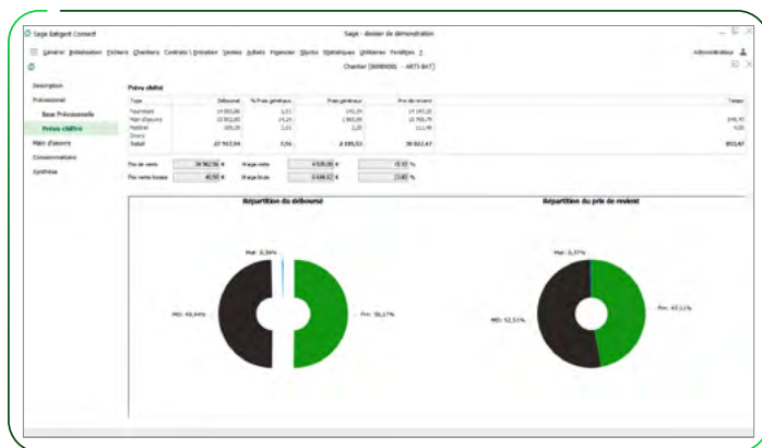
Interface chantier simplifié